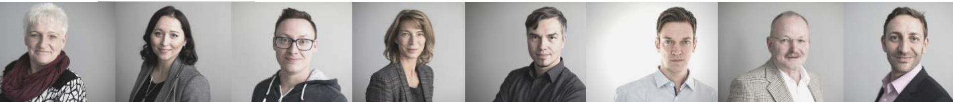
Markus Gosse Agentur Boxxom.com